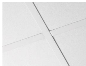
Optega A sistema