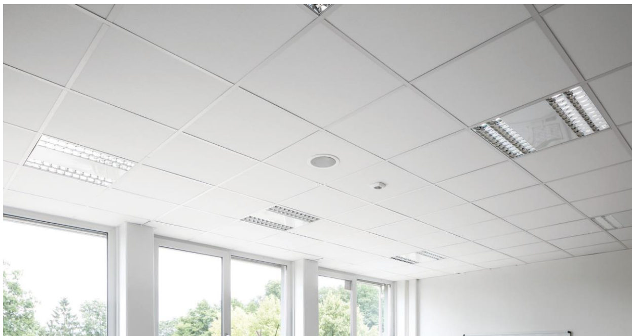
„Gesamtschule Ahaus“, Ahausas, Vokietija

Sistemą sudaro Ecophon Optega™ A plokštės ir Connect™ konstrukcija. Apytikslis sistemos svoris – 2,5 kg/m 2 . Plokštės pagamintos iš didelio tankio mineralinės vatos. Matomas paviršius padengtas baltai dažytu stiklo pluoštu, o galinė plokštės pusė padengta stiklo pluoštu. Plokštės Ecophon Optega™ A gaminamos su natūraliais kraštais. Konstrukcija pagaminta iš galvanizuoto plieno. Norėdami išlaikyti geriausias sistemos savybes ir kokybę, naudokite Connect™ konstrukciją ir kitus priedus.