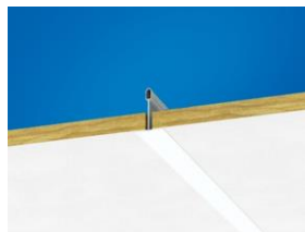
Optega A sistemos su Connect T24 dalis