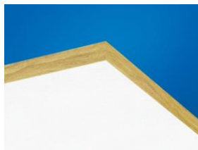
Optega A plokštė